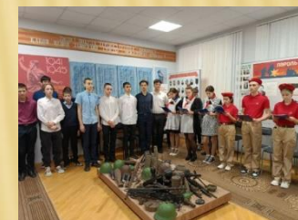
МУЗЕЙНЫЙ ЧАС «АФГАНИСТАН В МОЕЙ ДУШЕ»