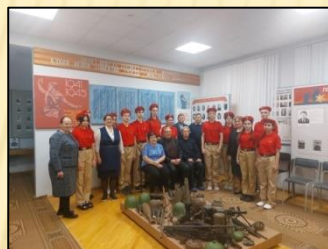
ВСТРЕЧА С СОВЕТОМ ВETERANОВ РАЙОНА