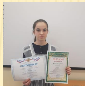
РЕГИОНАЛЬНАЯ КОНФЕРЕНЦИЯ «ОТЕЧЕСТВО» – 2 МЕСТО