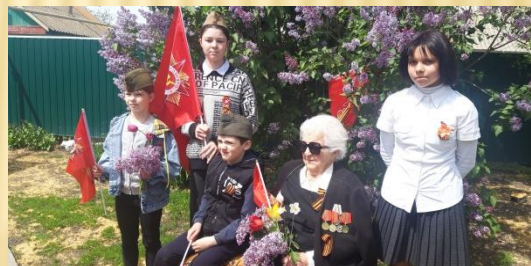
АКЦИЯ «ГЕОРГИЕВСКАЯ ЛЕНТОЧКА