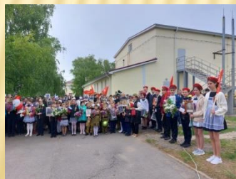
АКЦИЯ «БЕССМЕРТНЫЙ ПОЛК»