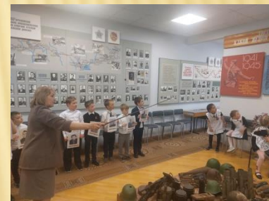
ЭКСКУРСИЯ «ПОДВИГ УЧИТЕЛЕЙ ПОМНИТЬ БУДЕМ»